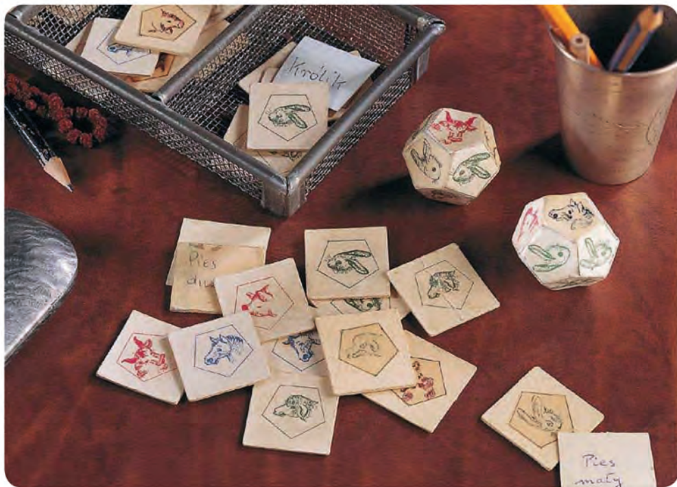
Originální hra „Chov zvířátek“ z roku 1943

U příležitosti 100. narozenin paní Borsukové, 25. výročí úmrtí jejího manžela a také u příležitosti 10. výročí obnovení výroby hry, jež nyní pod názvem Superfarmář baví další generace dětí i rodičů, přinesla Granna® na podzim roku 2007 novou, barevnější, prostornější a dynamičtější verzi, jejíž českou podobu vám nyní předkládáme.